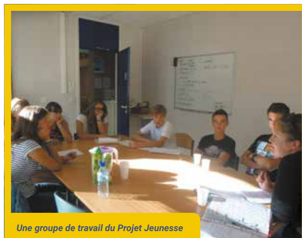
Une groupe de travail du Projet Jeunesse