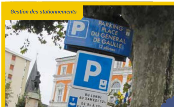
Gestion des stationnements