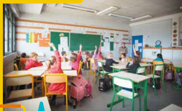
Atelier au Puy-Saint-Martin