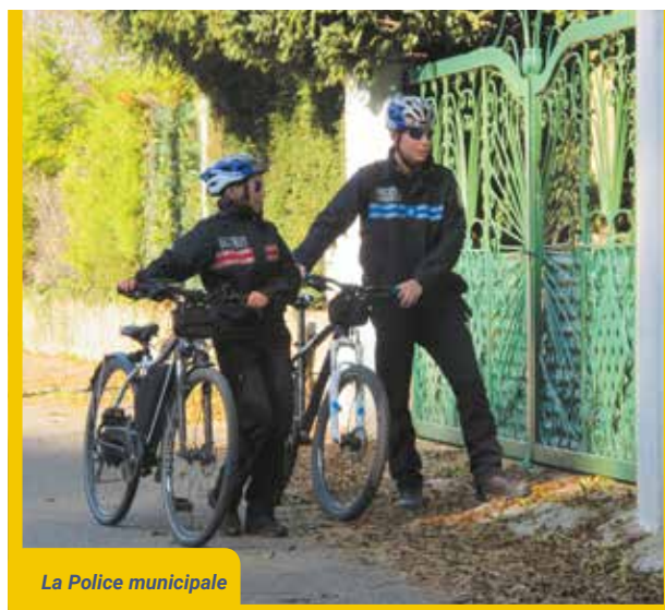
La Police municipale