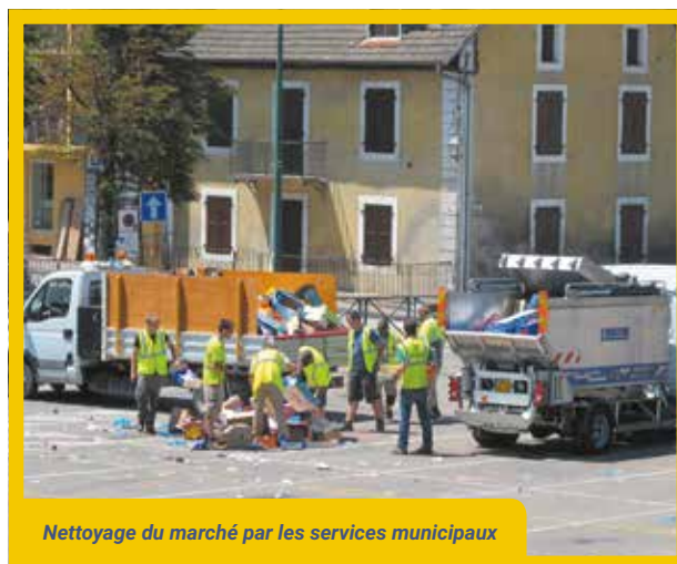
Nettoyage du marché par les services municipaux