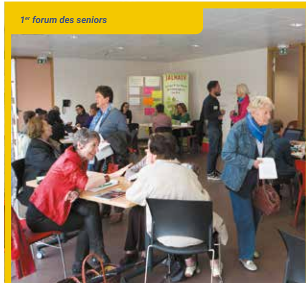
1 er forum des seniors